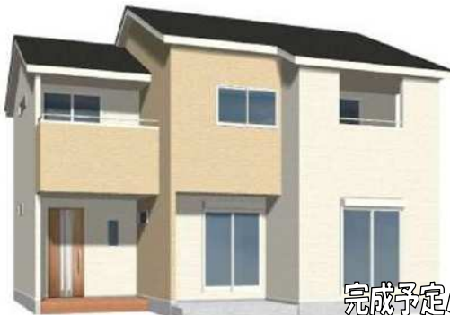
完成予定パース図

2,280 (税込) 万円~ 土地77.74坪(257.01㎡) 建物36.31坪(120.06㎡)