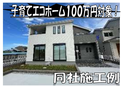
子育てエコホーム100万円対象!

毎月返済例 63,049円 2,690万円借入の場合 ポーナス無 変動金利 0.6% 40年返済 ※吉岡町大久保 全1棟予定あり